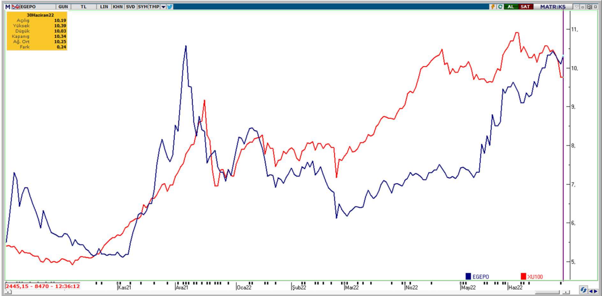
Grafik 3: BIST 100 Endeksi ve Şirket Pay Fiyatı

Şirket paylarının Borsa İstanbul'da işlem görmeye başladığı tarihten Şirket paylarının BIST 100 endeksine göre rölatif performansı aşağıda gösterilmiştir.