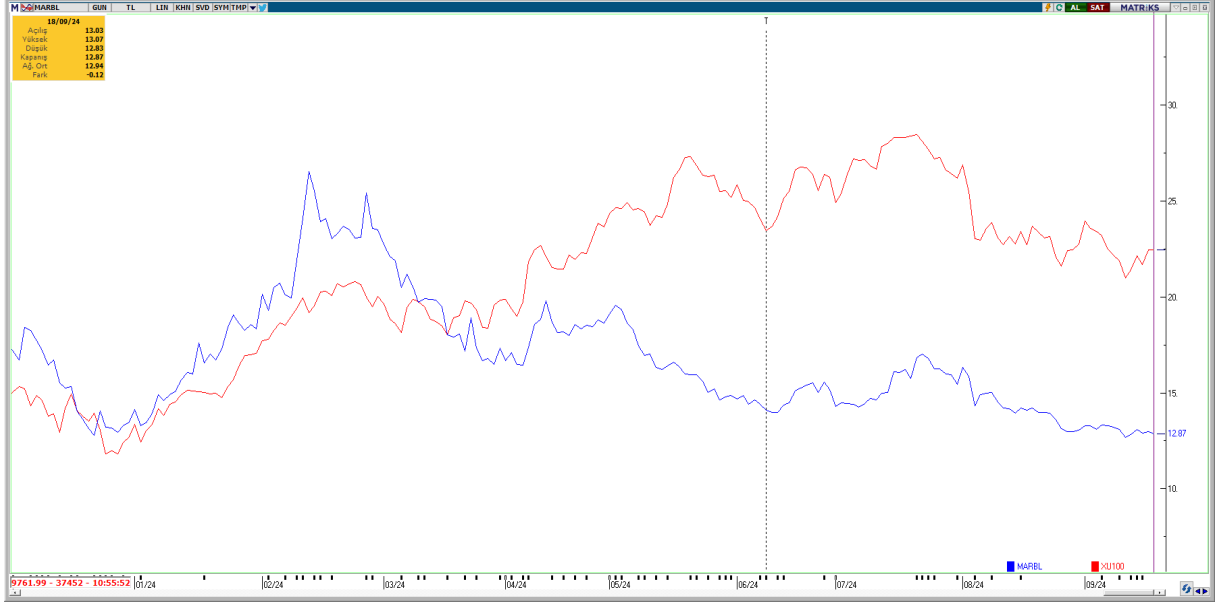
Grafik 3: BIST 100 Endeksi ve Şirket Pay Fiyatı