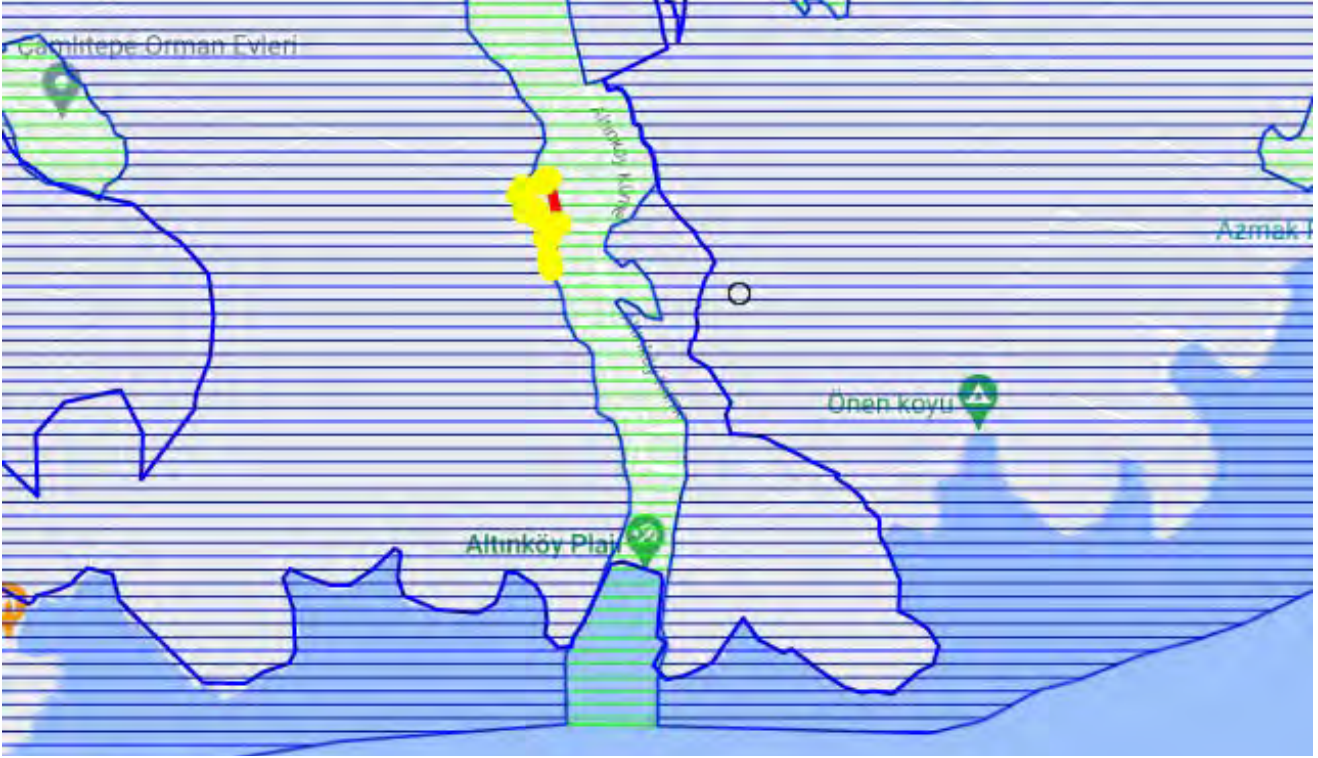
Koruma Alanlarına İlişkin Harita

Ayrıca ilgililerinden temin edilen İzmir Valiliği Çevre, Şehircilik ve İklim Değişikliği İl Müdürlüğü'nün yazısında;