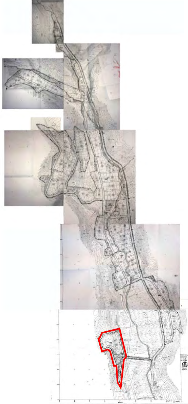
Mevzii İmar Planı

BÜTÜNLÜĞÜ GÖZETİLEREK ALT ÖLÇEKLİ PLANLARDA BELİRLENECEKTİR. 8.4.5.2. BU ALANLARDA ONAYLI ALT ÖLÇEKLİ PLANLARDA YOĞUNLUK ARTTIRICI DÜZENLEMELERE GİDİLEMEZ.