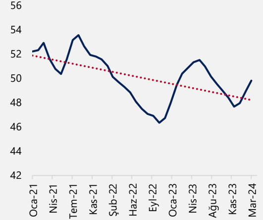
İmalat Sektörü PMI Endeksi (3-aylık HO)