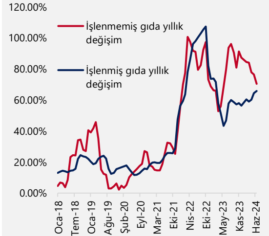
İşlenmemiş – İşlenmiş Gıda Fiyatları (yıllık)